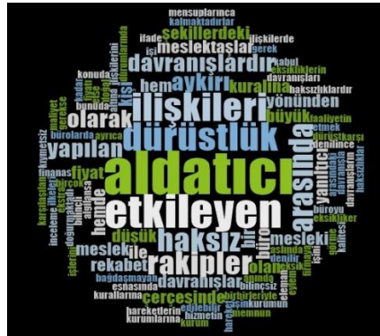
Şekil 1. Haksız Rekabet Kavram Kelime Bulutu

15 katılımcıdan sadece 1 kişi haksız rekabet kavramı ile ilgili tam bilgi sahibi değildir. Diğer 14 kişi haksız rekabet kavramı hakkında yeterli bilgiye sahiptir. Haksız rekabet kavram içeriği irdelendiğinde, tüm katılımcıların meslekte haksız rekabetin yapılmasının suç olduğu, mesleğin saygınlığını yitirdiği, yasa ve yönetmeliklerin haksız rekabeti önlemede yetersiz olduğu, haksız kazanç elde edildiği yönünde düşüncelerinin olduğu tespit edilmiştir. Haksız rekabet ile ilgili muhasebe mesleği kapsamında çıkarılan kanun ve yönetmelikler hakkında katılımcıların çoğunluğunun ilgili mevzuat hakkında bilgisi bulunmaktadır.